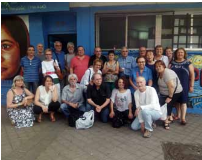
CHARLA SOBRE LA «HISTORIA DE LA ESCUELA DE ADULTOS DEL BARRIO DE EL PILAR. Escuela de Personas Adultas del Barrio de El Pilar (7 junio 2017). Grupo de antiguos y actuales profesores y alumnos de la Escuela