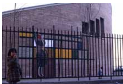
Montaje fotográfico «Imágenes Pinturas urbanas».