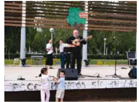
Montaje fotográfico «La M-30 es una calle...».