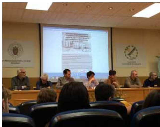
Universidad Complutense. Facultad de Geografía Historia. Seminario: «Historia abierta de Madrid. Una reflexión desde abajo sobre el pasado y la memoria de los barrios madrileños en el Siglo XX» (6 octubre 2018)