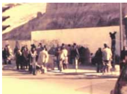
Fotograma del documental «Barrio de El Pilar. Pinturas urbanas».