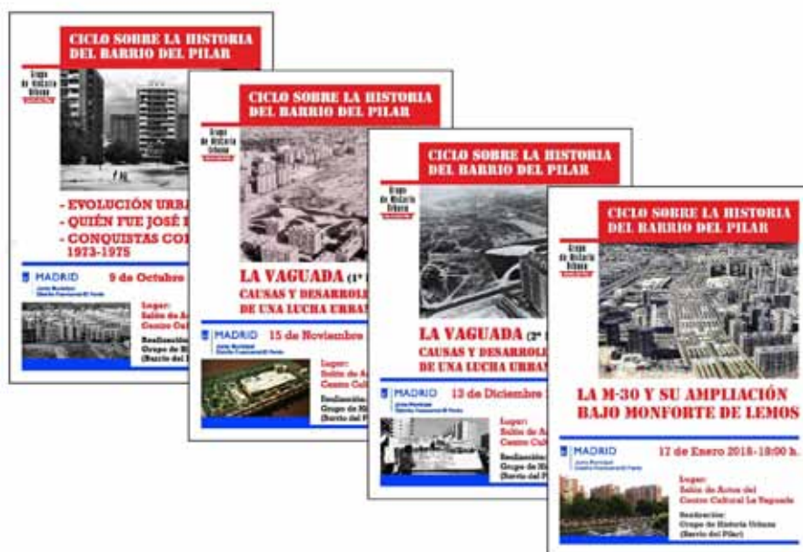
Conjunto de carteles correspondientes a las cuatro charlas del ciclo, impartidas en el Centro Cultural La Vaguada