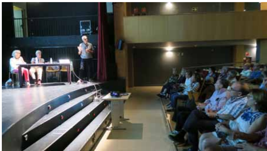
1ª CHARLA: «ORIGEN DEL BARRIO DE EL PILAR». Centro Cultural La Vaguada (9 octubre 2017)