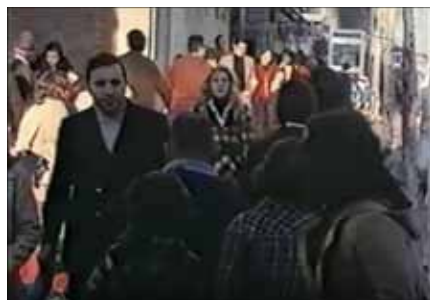
Fotograma del documental «La ciudad es nuestra».